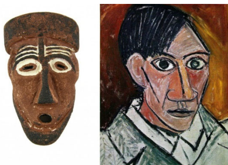
Máscara Africana e autorretrato de Picasso, 1907.