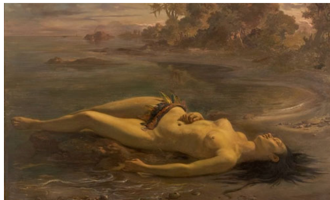
Moema, 1866. Museu de Arte de São Paulo

29.A obra “Moema” do pintor catarinense Victor Meirelles (1832-1903) inspira-se no canto VI do poema épico Caramuru (1781) do frei José de Santa Rita Durão (1722-1784). Analise a imagem e a estrofe XXXVII do poema, onde o autor narra a situação de Moema: